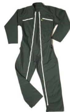
Combinaisons de travail