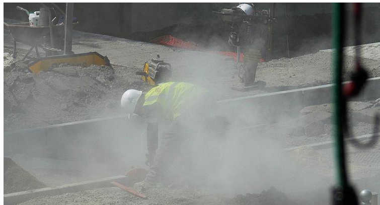
Ouvrier du bâtiment exposé aux poussières de silice

La silicose se traduit par une réduction progressive et irréversible de la capacité respiratoire (insuffisance respiratoire), même après l'arrêt de l'exposition aux poussières.