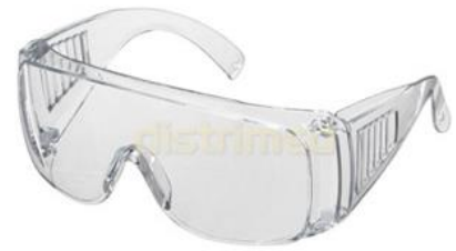
Lunettes de protection